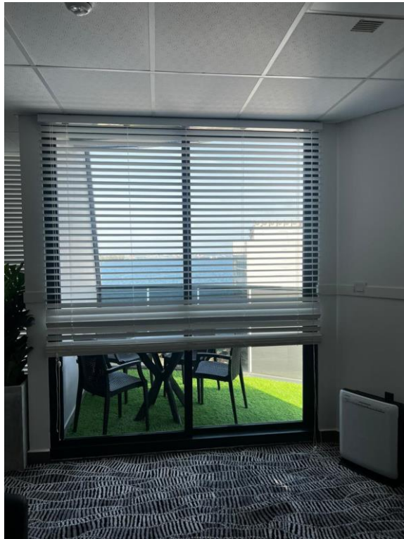
Room 2. Door 3. 2515 x 1219 mm