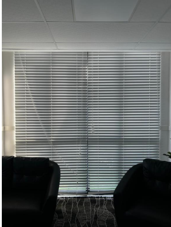
Room 2. Door 2. 2464 x 2057 mm