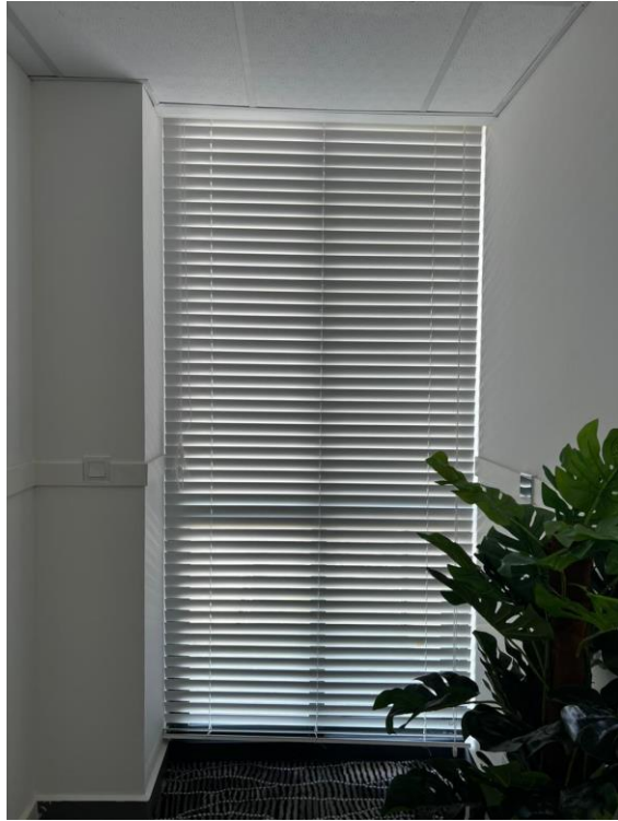
Room 3. Door 1. 2515 x 2540 mm